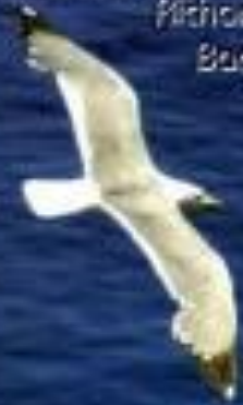
Illustration: Leo Poma